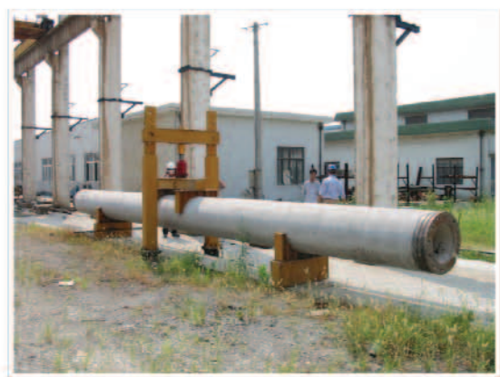
照片12 製成品抗彎試驗檢測