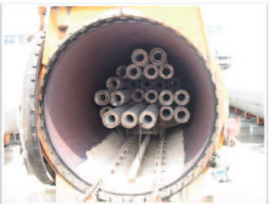
照片11 高壓蒸氣養生