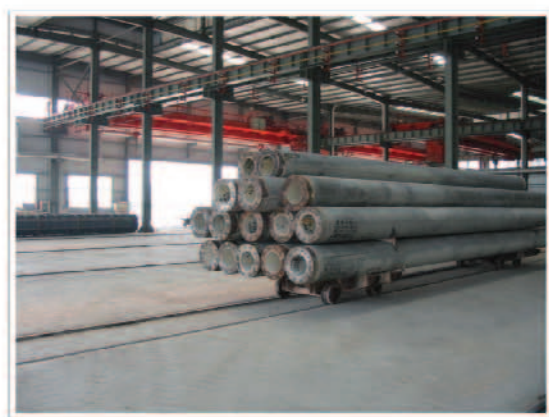
照片10 脫模後準備送至養生槽