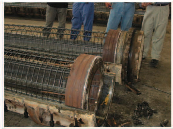
照片4 裝置端板與補強圈板