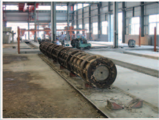
照片7 投料完成組合關閉鋼模