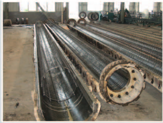
照片3 鋼筋籠置入鋼模