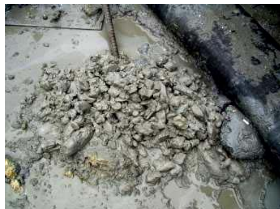
照片6 鑽掘達承載層確認(判岩)