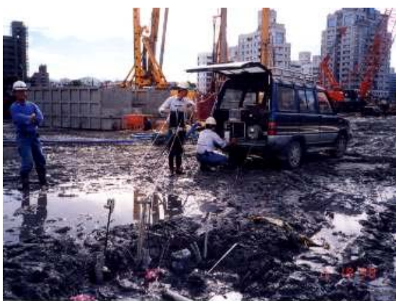
照片17 混凝土養護7日後樁體完整性檢測