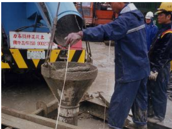
照片15 澆灌中混凝土上升深度量測