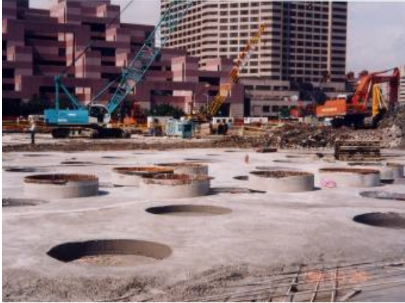
照片1 樁位放樣及穩定液沈澱池構築