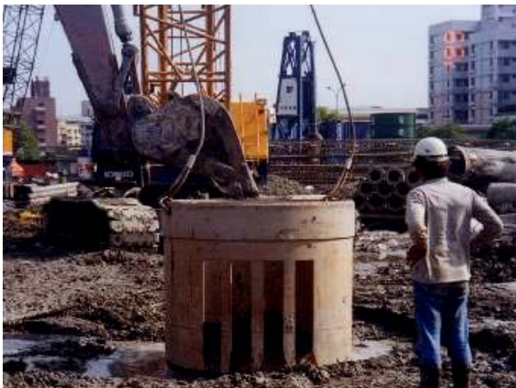
照片3 保護套管安裝