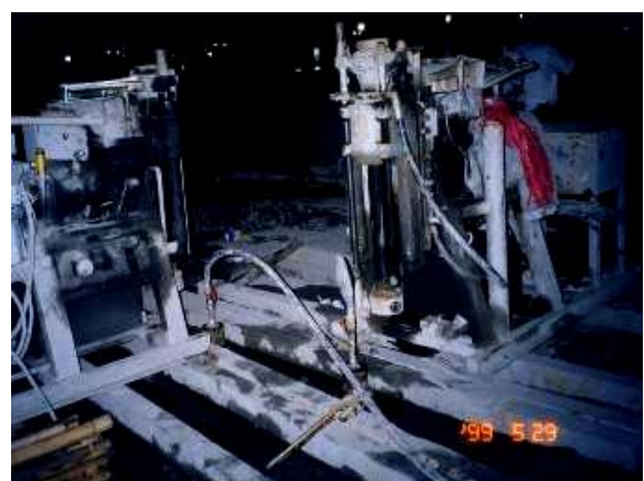
照片18 進行樁底沉泥清洗後灌漿