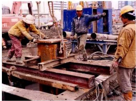
照片10 吊放逆打鋼柱(用作逆打樁時)