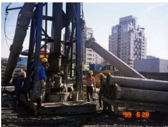
照片5 反循環鑽掘鑽桿裝設