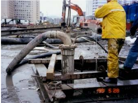
照片13 第二次沉泥清除後深度檢核