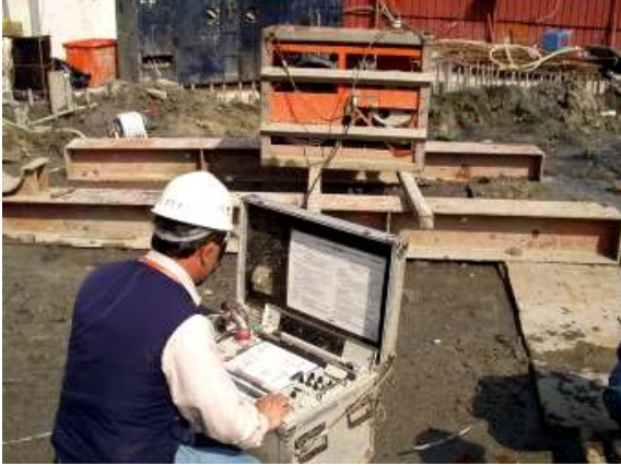
照片7 孔壁垂直度檢測