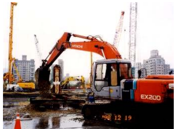
照片16 空打段回填碎石料