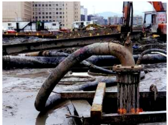
照片12 樁底第二次沉泥清除(Air-lift法)