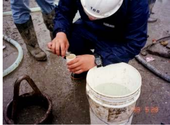
照片2 穩定液調製及品質檢測